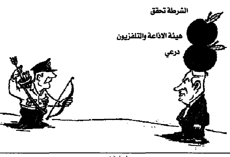
الشرطة تحقق هيئة الاداعة والتلفزيون درعي

يرمان وحلده سبيل نتنياهو، حتى ان نتنياهو هذا بدأ الامر، انذاك من وثقي اللاتر الى التي الشرقي، لم يتم صفة، وانما ذلك لم يكن يتم. يرمان وحلده سبيل نتنياهو، حتى ان نتنياهو هذا بدأ الامر، انذاك من وثقي اللاتر الى التي الشرقي، لم يتم صفة، وانما ذلك لم يكن يتم.